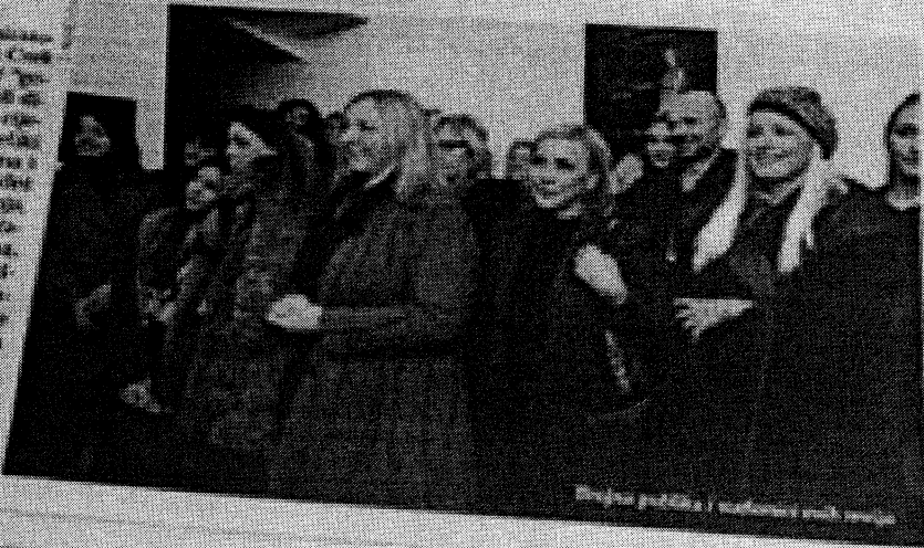
Modeli izložbe i dizajneri u izložbenom prostoru