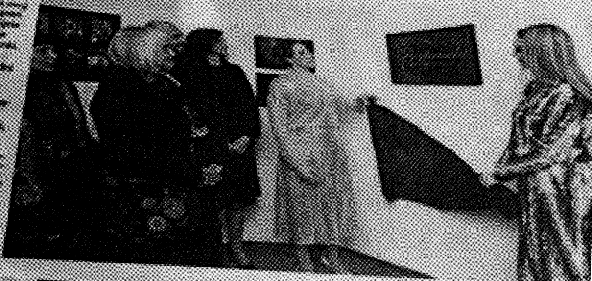
Modeli izložbe i dizajneri u izložbenom prostoru